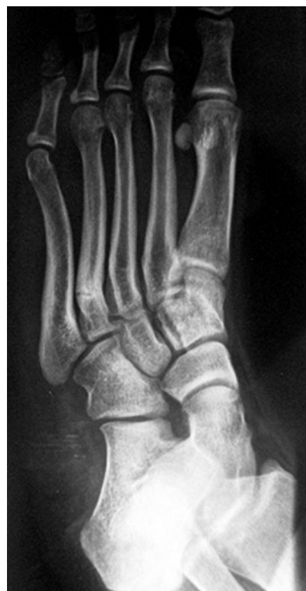
Figura 2. Radiografía simple con 6 meses de evolución

de cambios escleróticos e hipertrofia de los márgenes corticales (Figuras 2 y 3), esta situación fue interpretada como pseudoartrosis.