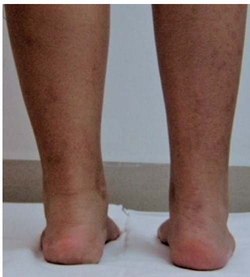
Figura 1. Vista posterior del paciente: observar la aducción de los metatarsianos

Una adolescente de 13 años fue evaluada en nuestra institución. Su queja principal consistía en dolor en el dorso del pie en la proyección de la base del cuarto metatarsiano. El dolor comenzó dos meses previos a la consulta. La paciente no presentaba historia de trauma agudo. El examen físico reveló dolor a la palpación de la base del cuarto metatarsiano y de la articulación tarso metatarsiana, así como la presencia de metatarso aducto (Figura 1). Las radiografías simples se encontraban dentro de límites habituales.