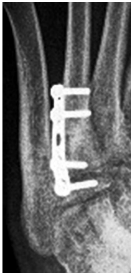
Figura 6. Radiografía simples - un año posoperatorio

Luego de tres meses del procedimiento, la paciente progresivamente retoma sus actividades previas sin nuevos síntomas. A un año posoperatorio, la paciente no reporto recurrencia de síntomas y la radiografía evidencio la curación completa de la pseudoartrosis (Figura 6). La remoción del implante no fue considerada dado que la paciente no presento signos de intolerancia.