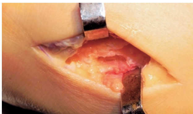
Figura 4. Identificación del foco de fractura

Dada la cronicidad de los síntomas, la intervención quirúrgica fue realizada 11 meses luego del inicio de los síntomas. Se realizó un abordaje dorsal sobre el cuarto metatarsiano y la línea de fractura fue identificada mediante maniobras de distracción (Figura 4). El hueso esclerótico fue removido, e injerto cortico esponjoso encastrado, tipo inlay fue posicionado en el sitio de no unión (Figura 5).